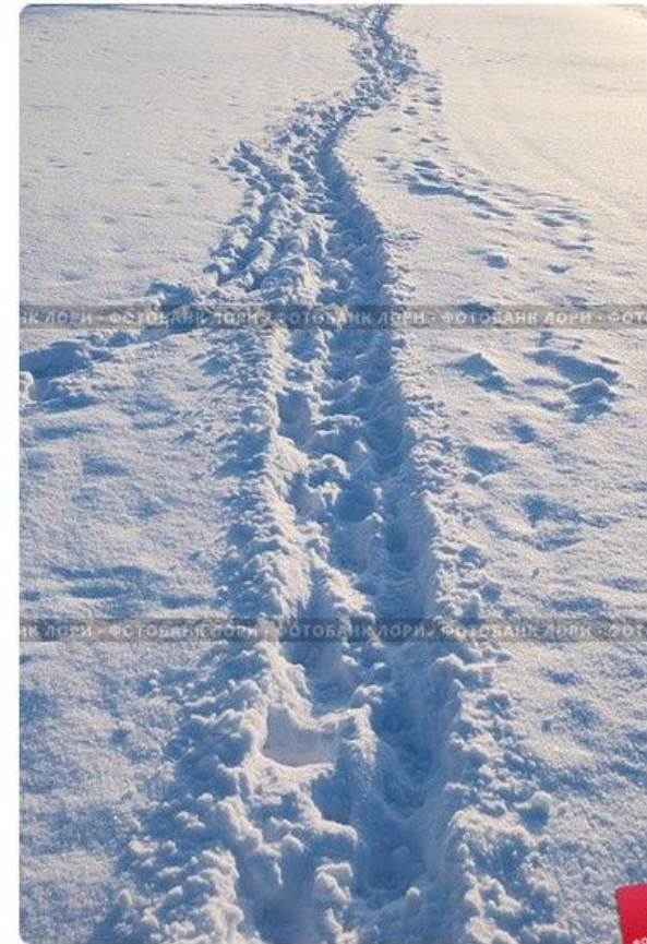
Тропинка на снегу

В холодное зимнее время студенты университета пересекают наискосок большую прямоугольную лужайку перед входом, стремясь поскорее согреться в здании. В результате протапывают дорожку в снегу, прокладывая которой никем не замышлялось. Появление этой дорожки служит моделью создания институтов (Voettke, 2010. P. XVI).