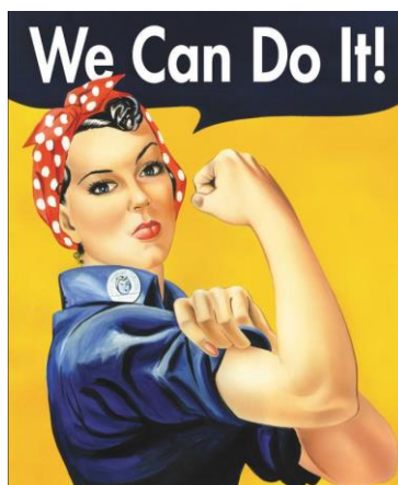
Американский плакат периода войны