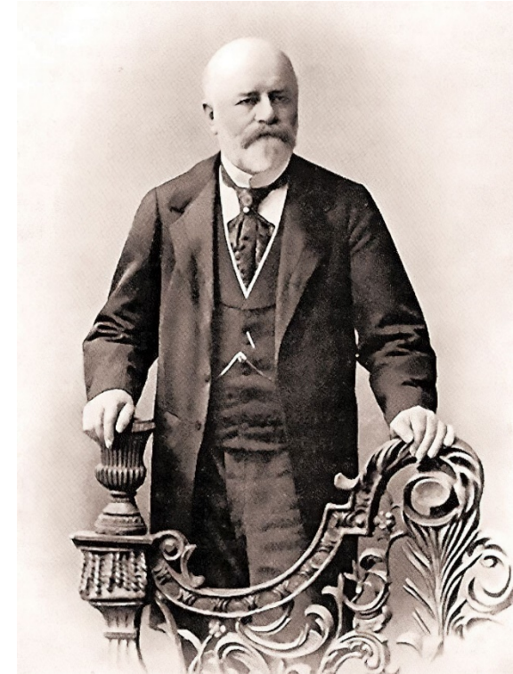
И.С. Блюх 1836-1902

Скончался в 1902 г. в возрасте 65 лет. Похоронен в Варшаве.