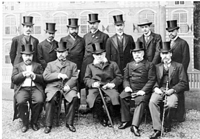
Российская делегация на Гаагской конференции 1899 года

В 1901 году по итогам Гаагской конференции и за свою книгу Блюх был даже номинирован на только что появившуюся Нобелевскую премию мира , но лауреатом не стал. Его опередил швейцарец Анри Дюнан, создатель «Международного Красного креста».